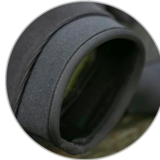
Der Handschuh ist mit einer laminierten elastischen Neoprenmanschette ohne Verschluss ausgestattet