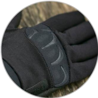
Handrücken des Handschuhs aus Neopren zum Schutz der Gelenke