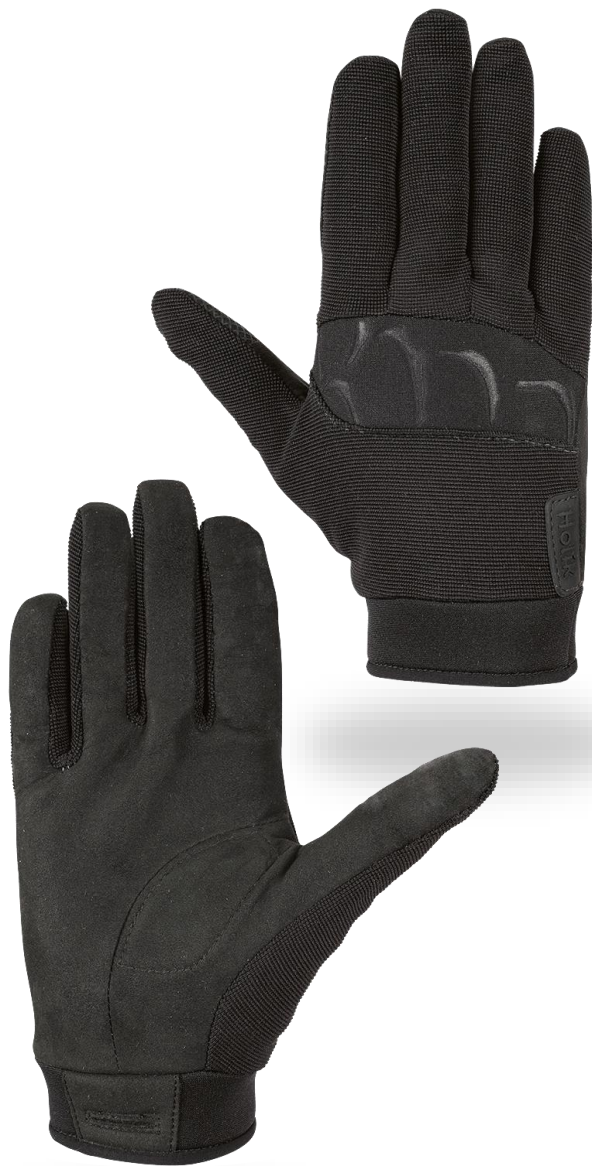
EBBE Short Black

Leichter Textilhandschuh für den Umgang mit Waffen und zur Personenkontrolle für alle Armee-, Polizei und Sicherheitskräfte.