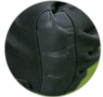
Handrücken: Elastisches Gestrick PA/Spandex